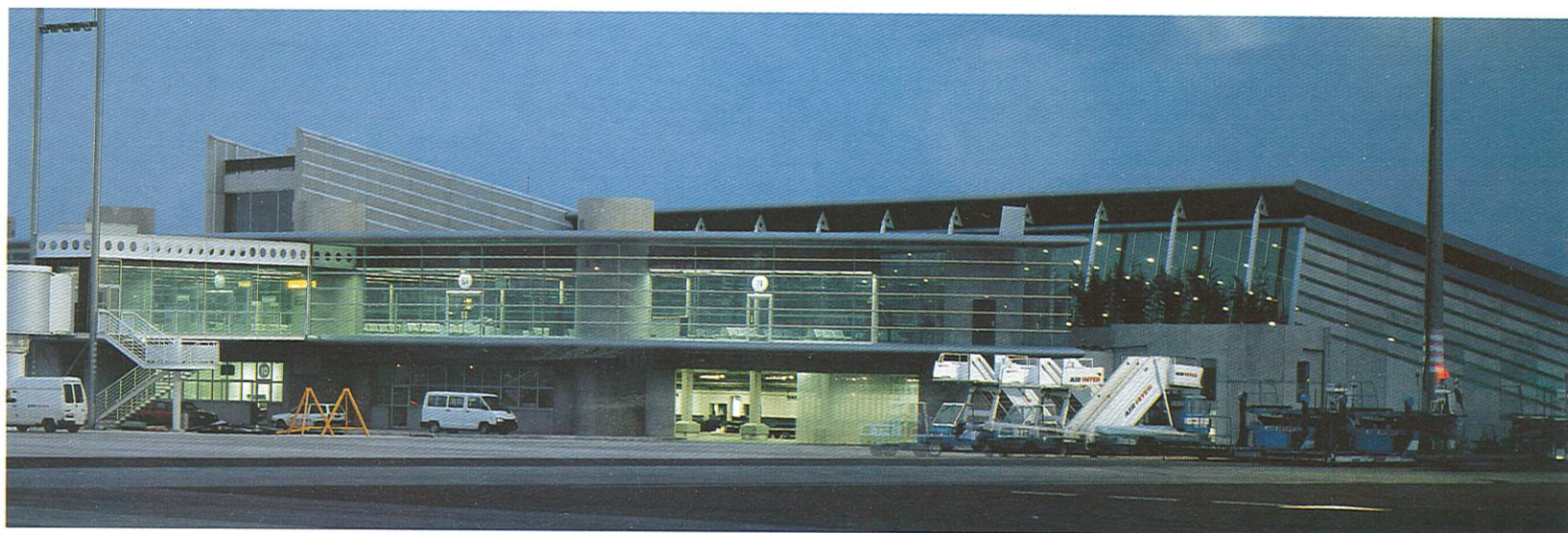
- Le cheminement du passager, de l'accueil jusqu'aux salles d'embarquement a servi de thème de réflexion aux concepteurs - From the check-in area to the departure lounges, passenger orientation is the guiding factor for the designers.