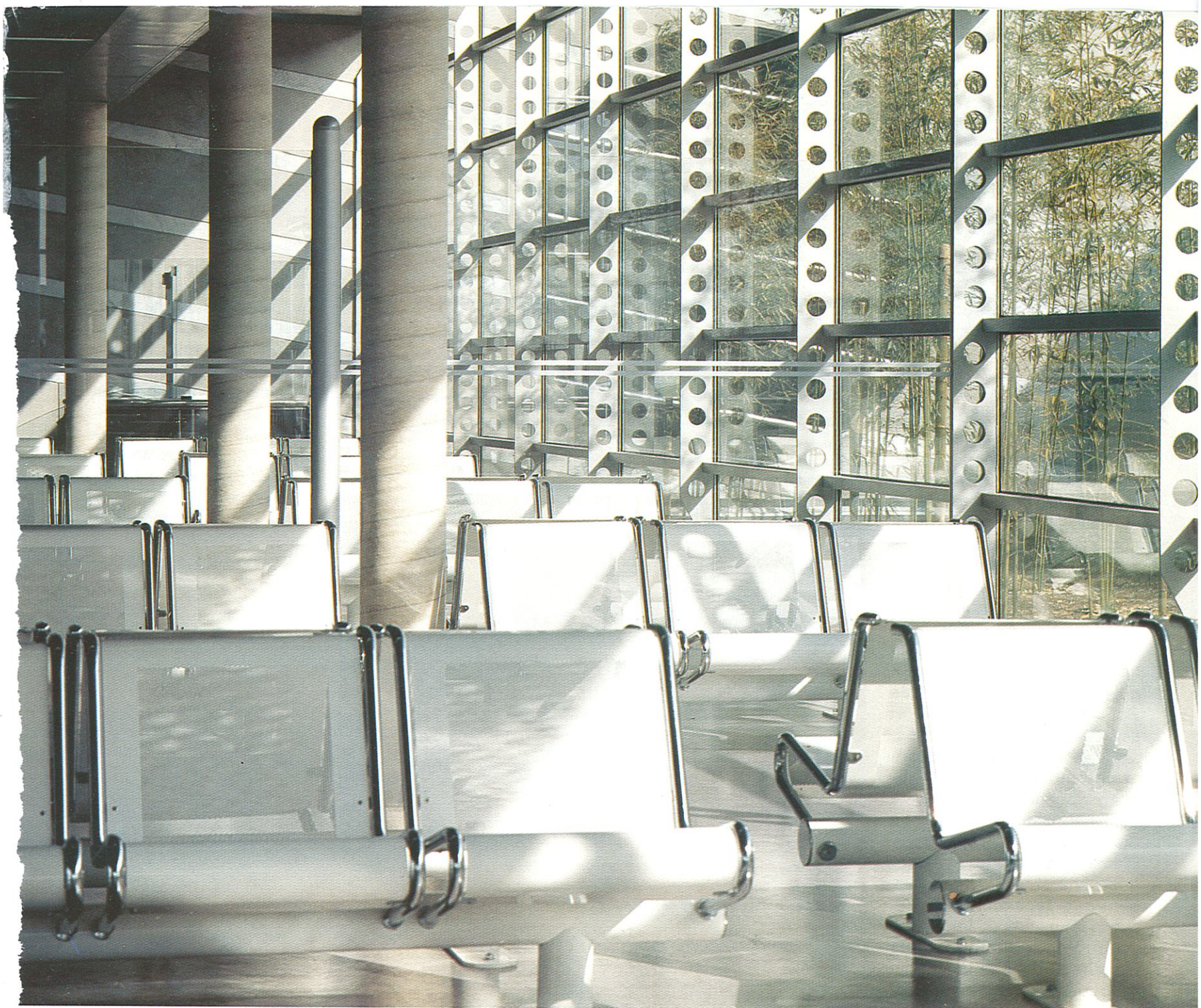
- Salle d'attente: la lumière disciplinée explore les différents espaces - The waiting room: controlled lighting highlights various areas