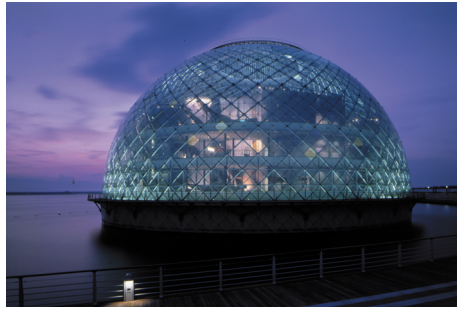
02. Musée maritime d'Osaka (1993-2000)