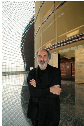
04. Paul Andreu dans l'Opéra de Pékin © Paul Andreu architecte avec Groupe ADP et BIAD photo : Paul Maurer