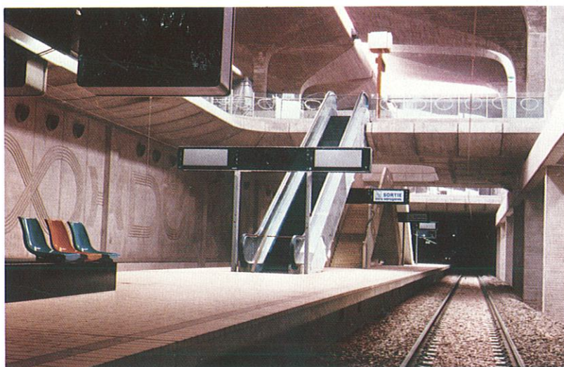
Vue au niveau des quais

L'infrastructure lourde de la gare est actuellement réalisée dans son ensemble mais une partie du hall seulement est aménagée dans cette première phase de fonctionnement, l'extension étant prévue en fonction de la construction de la zone d'animation publique qui sera construite alentour.